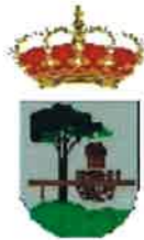
Quintanar de la Sierra