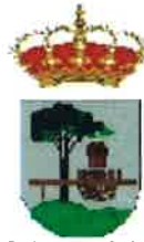
Quintanar de la Sierra