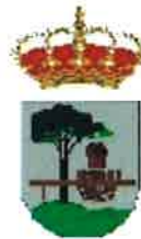
Quintanar de la Sierra