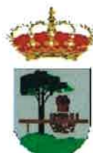
Quintanar de la Sierra