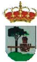
Quintanar de la Sierra