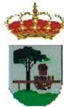
Quintanar de la Sierra