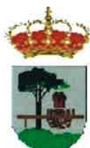
Quintanar de la Sierra