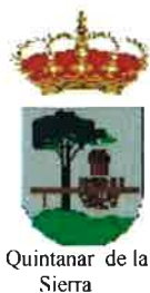
Quintanar de la Sierra