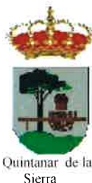
Quintanar de la Sierra