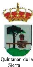
Quintanar de la Sierra