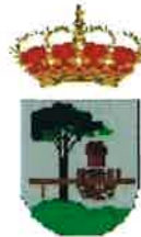
Quintanar de la Sierra