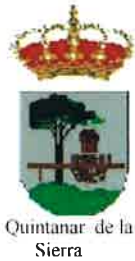
Quintanar de la Sierra