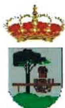
Quintanar de la Sierra