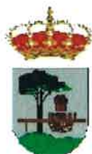
Quintanar de la Sierra