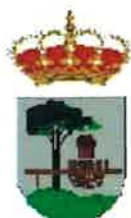
Quintanar de la Sierra